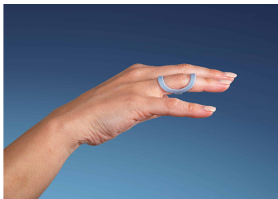
B. Swan Neck Deformity